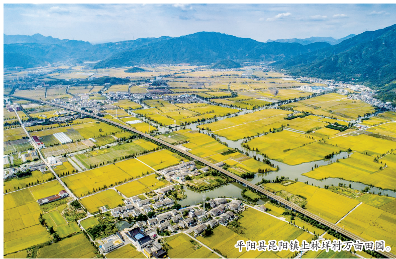
平阳县昆阳镇上林垵村万亩田园。

发乡村发展内生动力。 发挥全国农村改革实验区优势，持续擦亮农村“三位一体”综合改革名片。加快农村产权交易市场“六统一”建设，实现农村产权交易总额20亿元以上。扎实推进农村乱占耕地建房住宅类房屋专项整治第二步试点。盘活闲置农房1500宗以上。