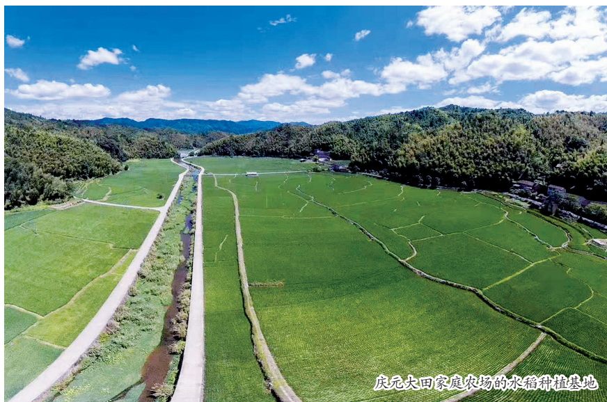
庆元大田家庭农场的水稻种植基地

牌。籼粳杂交米,不仅有籼米的蓬松清香,又有粳米的柔滑微甘,颇受消费者喜爱。这次15个金奖品牌稻米中,5个籼粳杂交品种,甬优系列占了3个,分别是“甬优7860”“甬优15”“甬优17”;而在20个优质奖产品中,籼粳杂交稻米占了7个,其中“甬优”系列品种有4个。